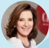
Romy Faisst Business Circle